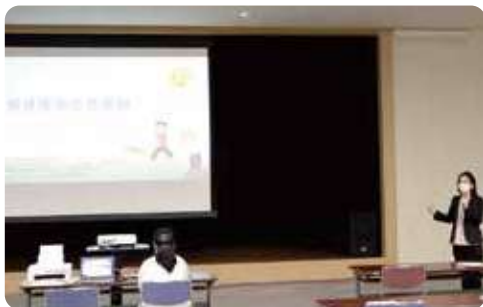
おしゃべり カフェの様子

LivingPlusOne は「明日の社会をみんなで作る」ことを目的に立ち上げました。現在「中等教育の特別支援を考える会」と「シスルの会」が活動をしています。障がいのある方、高齢の方、みんなが等しく幸せでありたいと支援をしています。