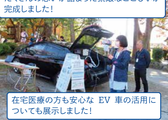
在宅医療の方も安心なEV車の活用についても展示しました!