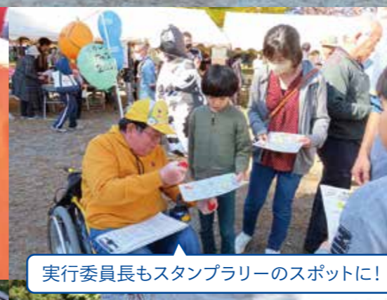
実行委員長もスタンプラリーのスポットに!