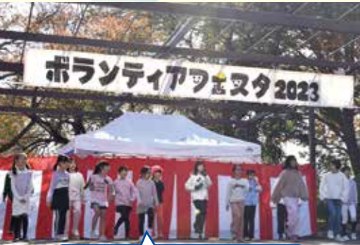
オープニングは四賀小学校合唱団のみなさんに盛り上げてもらいました。