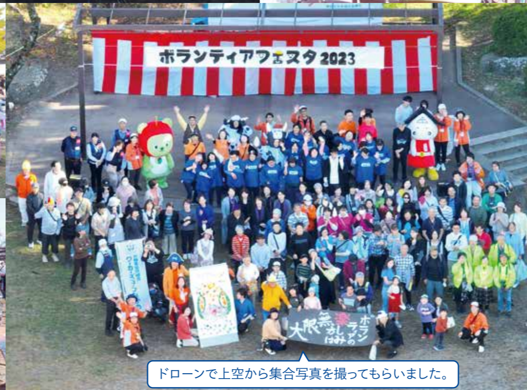
ドローンで上空から集合写真を撮ってもらいました。