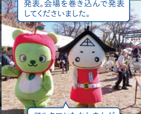
アルクマとたかしまんが来てくれました!