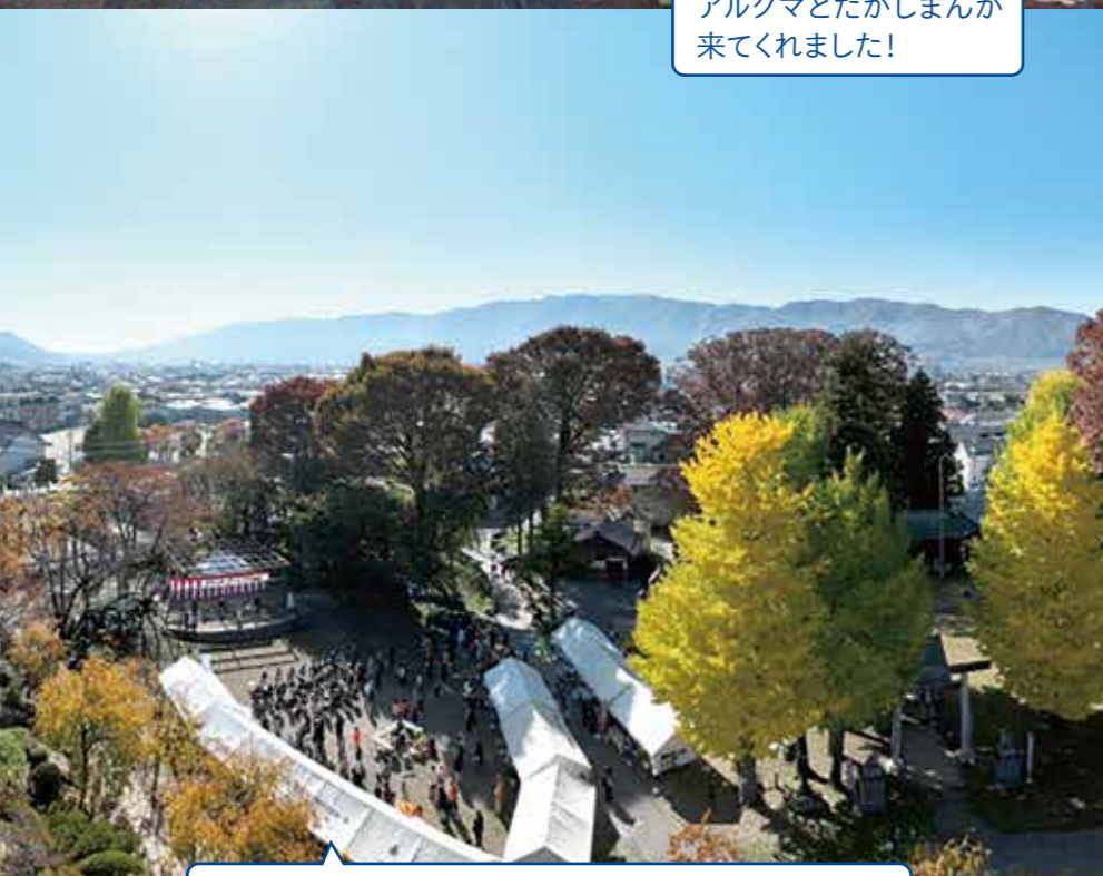
ドローンで撮影した高島公園内最高な天気でした!