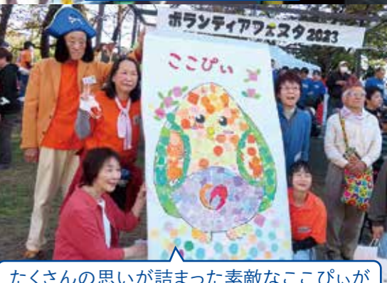
たくさんの思いが詰まった素敵なここぴいが完成しました!