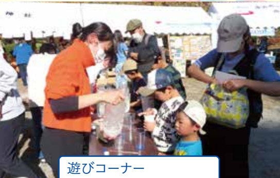
遊びコーナー スライムをつくりました!!