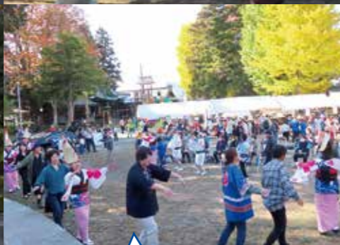
阿波踊り諏訪湖連のステージ発表。会場を巻き込んで発表してくださいました。