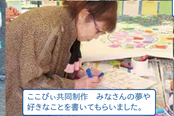
ここぴい共同制作 みんなの夢や好きなことを書いてもらいました。